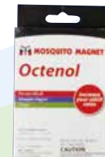
誘引剤(3個入り) (オクテノール ※イエカ向き) ¥5,508(税込)