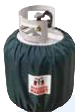
タンクカバー (※10kg、8kg対応) ¥3,240(税込)