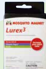
誘引剤(3個入り) (ルレックス3 ※ヤブカ向き) ¥6,588(税込)